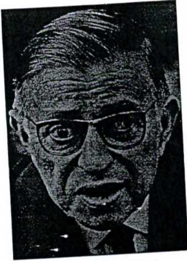
ז'אן פול סארטר

להפוך את הסכסוך המזרח-תיכוני לסיפור בנוסח קוסובו ולהציג את ישראל כסרביה, כדי לדרוש התערבות בינלאומית, שלבטח תועיל להם. על מסע ההכפשה הזה מנצחות ביד רמה שדולה עולמית פרר-ערבית חזקה והתנועה הקולנית למדי של השמאל הקיצוני ושל הפוסט-מודרניסטים היהודים. מסע הסברה זה נשען על מספר רב של עמותות וארגונים לא-ממשלתיים "הומניטריים" ו"שוחרי חסד", הקיימים בכל מדינות המערב ובישראל, ואלה מעבירים זה לזה את סיסמאותיו. כך נוצר בלבול מוחלט של מוחות וניתן מבול של אי-הבנות, ואלה גורמים לכך שאנשים מתרחקים מיהודים, ששוחת בידוד נפגעת סביב היהודים וכל הקשור בהם הופך לטאבו.