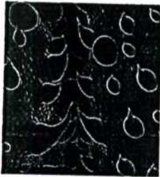
trichomes à la surface d'une feuille de cannabis ( Cannabis sativa ) [microscopie électronique à balayage, fausses couleurs]

— Hist. En 1986, après la victoire du parti de l'Alliance nationale pour la reconstruction, Raymond Robinson devient Premier ministre et décide de faire de la reprise économique une priorité absolue. En 1989, un débat constitutionnel a lieu afin d'envisager l'élaboration d'un projet permettant la sécession de l'île de Tobago. En décembre 1991, M. Patrick Manning, dirigeant du Mouvement national du peuple (social-démocrate) est nommé